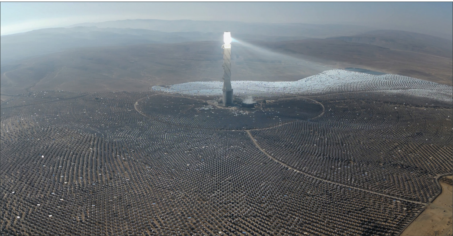
Mega-proyecto termo-solar de Ashalim.

La empresa israelí Noy Fund es la principal promotora del proyecto. La francesa Alstom se encargará de la construcción, el suministro, la explotación y el mantenimiento de la planta durante 25 años, mientras que la estadounidense Bright Source se encargará del diseño y la construcción de la torre de electricidad. 84 El proyecto cuenta con la financiación de EIB , Bank Hapoalim , Menora y Harel , entre otros. 85 Las empresas promotoras contrataron los servicios de la española IMASA en 2017 para la construcción de plantas termosolares. 86