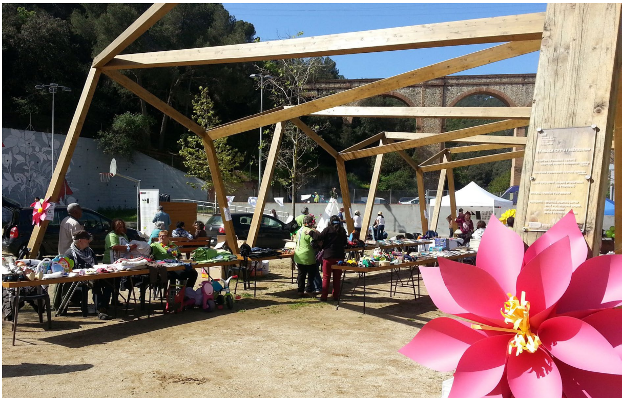
ASSOCIACIÓ DE VEÏNS DE CIUTAT MERIDIANA

“ El barri està aprenent a ser un actor, perquè només fent barri podem confrontar de manera real i efectiva l'extrema dreta. ”