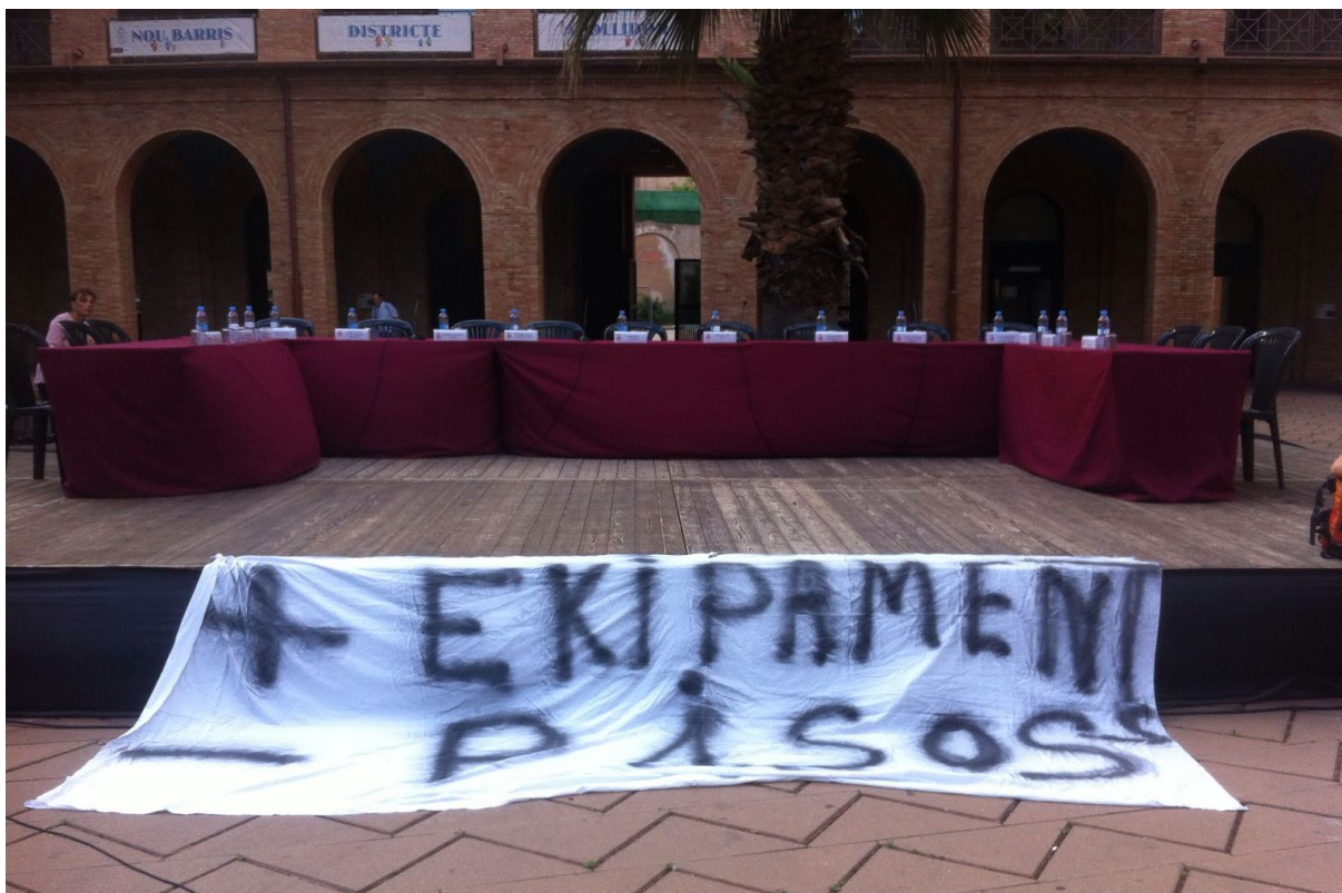
TAULA OBERTA DE TRINITAT NOVA