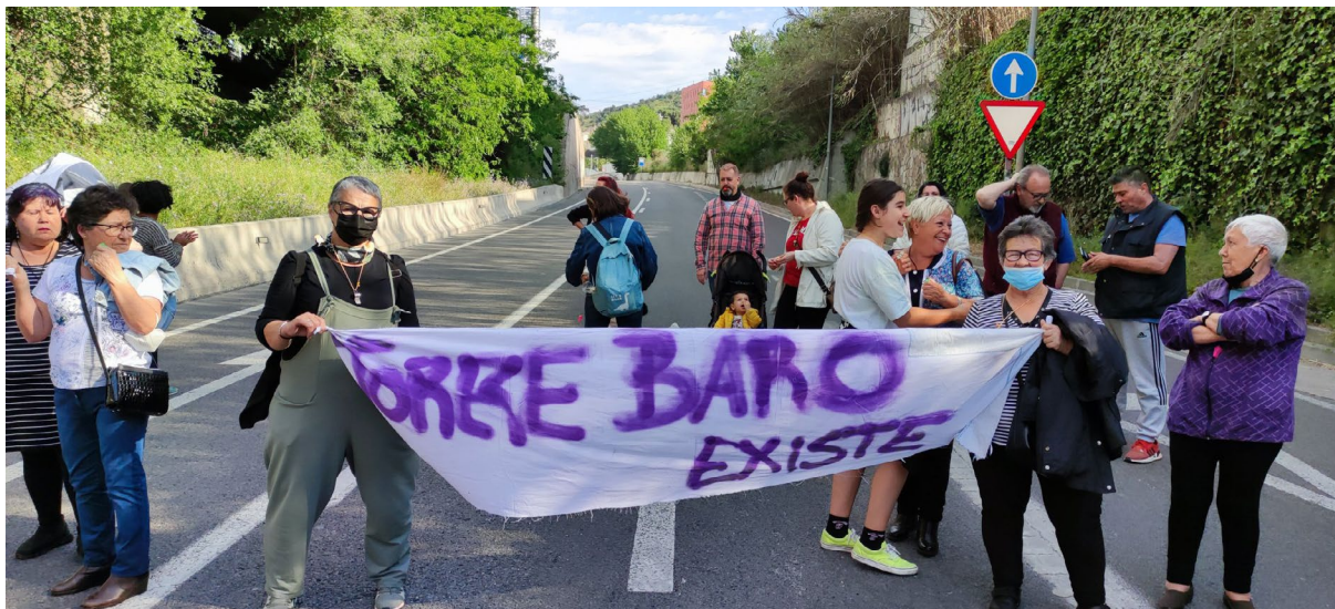
ASSOCIACIÓ DE VEÏNS DE TORRE BARÓ

tall d'anècdota. Des de feia anys que el moviment veïnal reclamava que l'estació de rodalies de Renfe de Torre del Baró explicités el nom de Barcelona, de la mateixa manera que es fa amb la resta d'estacions de la ciutat ("Barcelona - Passeig de Gràcia", "Barcelona - Sants", "Barcelona - El Clot Aragó"...). No va ser fins fa un parell d'anys que es va acceptar, a la cartelleria de rodalies, que Torre Baró i Vallbona també formaven part de Barcelona.