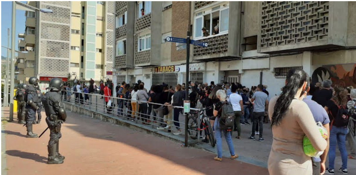
ASSOCIACIÓ DE VEÏNS DE CIUTAT MERIDIANA

D'altra banda, la tensió que exerceix la precarietat sobre la vida de les persones és la palanca ideal que pretén activar l'extrema dreta. Així doncs, aquesta tensió es transforma en un estat d'alerta constant que els discursos extremistes han sabut aprofitar a la perfecció per assenyalar un culpable fàcil: "si no hi ha oportunitats laborals, és culpa de les migracions". Els discursos racistes i xenòfobs tenen més facilitats per instal·lar-se a les llars que conviuen amb aquest estat d'alerta. L'enorme problemàtica de l'habitatge -tenint en compte que Ciutat Meridiana és un dels barris amb més desnonaments, que fins i tot ha estat batejada irònicament amb el nom de "Villadesahucio" 18 - és presentada per l'extrema dreta com un camp de batalla entre veïns. En conseqüència, si una família migrant accedeix a un pis de protecció oficial, pretendran estendre la idea que aquella família ha "robat" el pis a una família "d'aquí".