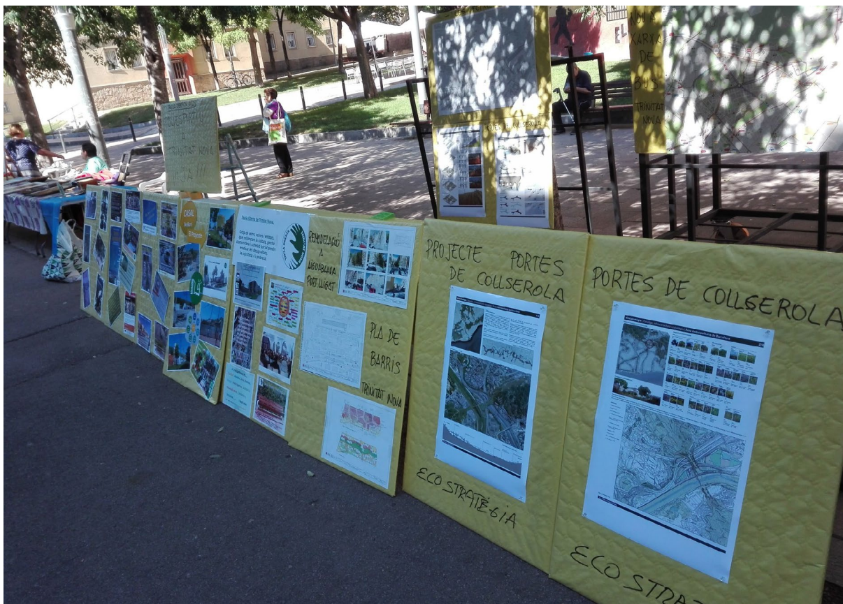
TAULA OBERTA DE TRINITAT NOVA