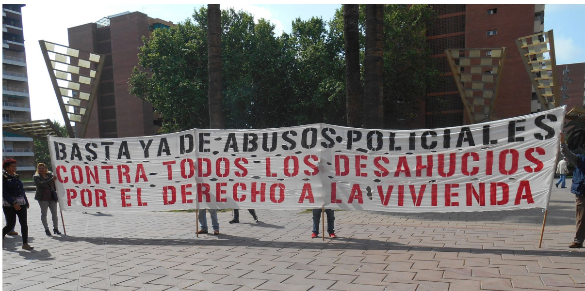
ASSOCIACIÓ DE VEÏNS DE CIUTAT MERIDIANA

Un segon element narratiu que apareix en bona part dels discursos extremistes pretén reforçar la idea que vivim en una situació d'inseguretat . Amb una predilecció gens casual per vincular els problemes de seguretat amb les migracions i constituint així un pol d'emissió de discursos d'incitació a l'odi, els arguments engrandeixen els casos de delinqüència i tendeixen a equiparar discursivament la conjuntura actual a una situació de risc i un punt de no retorn. En aquest sentit, els esforços per difondre totes les notícies de successos que tenen a veure amb l'incivisme, els delictes sexuals, les baralles, el tràfic de drogues, els robatoris i els atracaments seran tan elevats com els que es destinaran a relacionar cadascuna d'elles amb el fenomen migratori. De manera paral·lela, tot i que no menys important, tractant-se de l'habitatge un tema cabdal a Torre Baró, Ciutat Meridiana i Trinitat Nova, també podríem incloure aquí les narratives al voltant de l'okupació. En efecte, sense gairebé fonament polític, s'assenyala les okupacions com a principal causa de l'encariment del preu de l'habitatge, i es promou la por envers el petit propietari difonent la idea que li poden sostraure el seu pis. De nou, es torna a insistir amb la vinculació de la problemàtica de l'okupació amb les comunitats migrades.