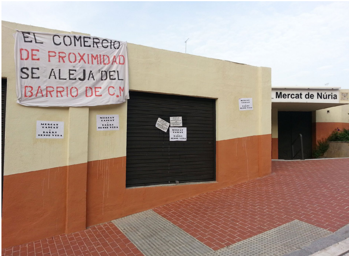
ASSOCIACIÓ DE VEÏNS DE CIUTAT MERIDIANA

fossin accessibles per al conjunt de veïns i veïnes dels seus barris. Des de la Coordinadora Cultural de Nou Barris també esmentaven que algunes de les poques propostes culturals i d'oci que ha impulsat l'Ajuntament de manera directa, no només re-centralitzaven l'activitat cultural en altres punts del Districte sinó que, en algunes ocasions, coincidien i feien ombra a activitats organitzades des de la societat civil dotades de molt menys pressupost.