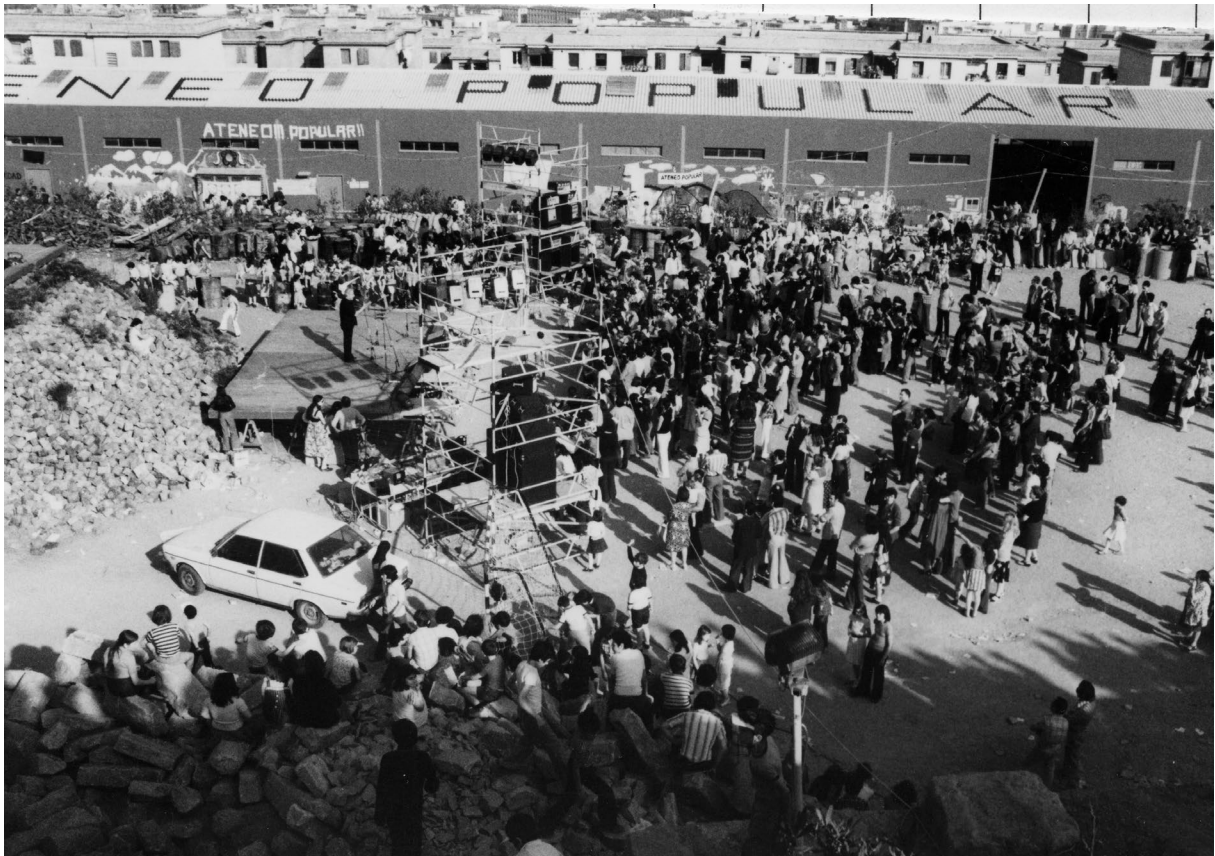
ATENEU POPULAR DE 9 BARRIS

reivindicar el títol de la revista associativa de la zona. Història i referent del moviment veïnal, els habitants del nord de la ciutat han estat sempre un exemple de mobilització, resiliència i perseverança en reclamar els seus drets. Tant és així, que les seves fites històriques els precedeixen, convertint-se fins i tot en mites que desprenen orgull de barri, com el de l'autobús que van segrestar per fer arribar el transport públic a Torre Baró o la planta asfàltica, que feia frontera entre Verdum, Roquetes i Trinitat Nova, que va ser ocupada i desmantellada pel veïnat per acabar convertint-la en l'Ateneu Popular 9 Barris.