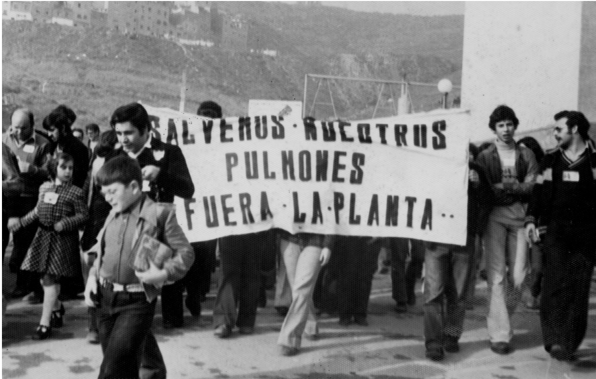
ATENEU POPULAR DE 9 BARRIS

la pobresa i la precarietat, la identitat, l'envelliment de la població, el deteriorament dels moviments veïnals, l'abandonament institucional i la manca de cohesió social. Malgrat haver classificat les diferents causes en aquestes categories -algunes d'elles molt àmplies-, la gran majoria estan interrelacionades entre sí, independentment de l'eix temàtic on s'hagin ubicat.