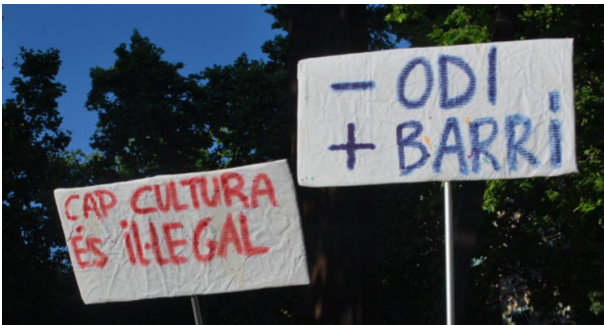
PODER POPULAR (16/05/2017): NOU BARRIS FA FRONT A L'EXTREMA DRETA.