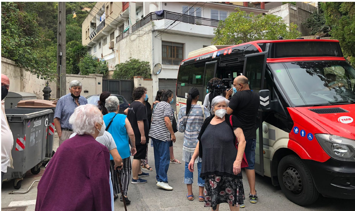
ASSOCIACIÓ DE VEÏNS DE TORRE BARÓ

D'altra banda, i reiterant elements que s'han esmentat anteriorment, les condicions econòmiques de les persones grans han anat en detriment els darrers anys. De fet, gairebé el 15% de les persones grans a l'Estat espanyol perceben una pensió inferior als 700€ al mes, una xifra per sota el llindar de la pobresa 25 . La precarització de la gent gran a través d'un sistema fràgil de pensions , que afecta especialment a les dones i a les persones que han treballat a la llar o sense cotitzar durant anys, s'aguditzava encara més en un entorn on no hi ha gairebé comerços, on l'espai públic no està adaptat a la mobilitat reduïda i on la meitat de carrers fan pujada.